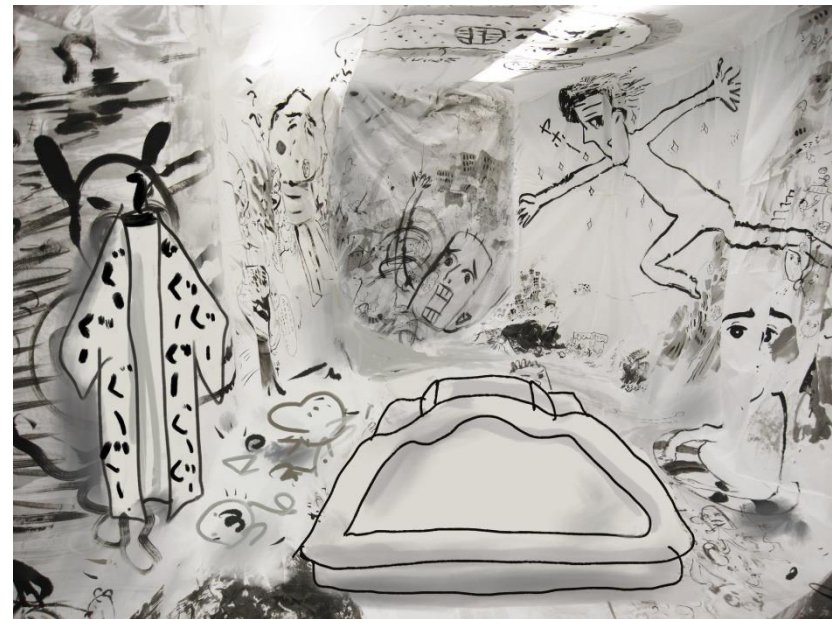
作品完成イメージ