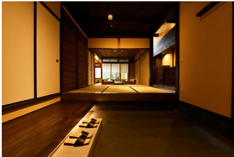
藏や千本三条内観 1

※この企画書内の画像は、すべて掲載OKです。 高解像度は下記お問合せ先までご一報ください。