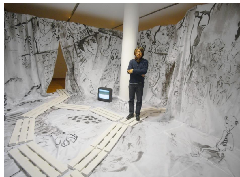
墨絵インスタレーションイメージ (2008年ドイツ)