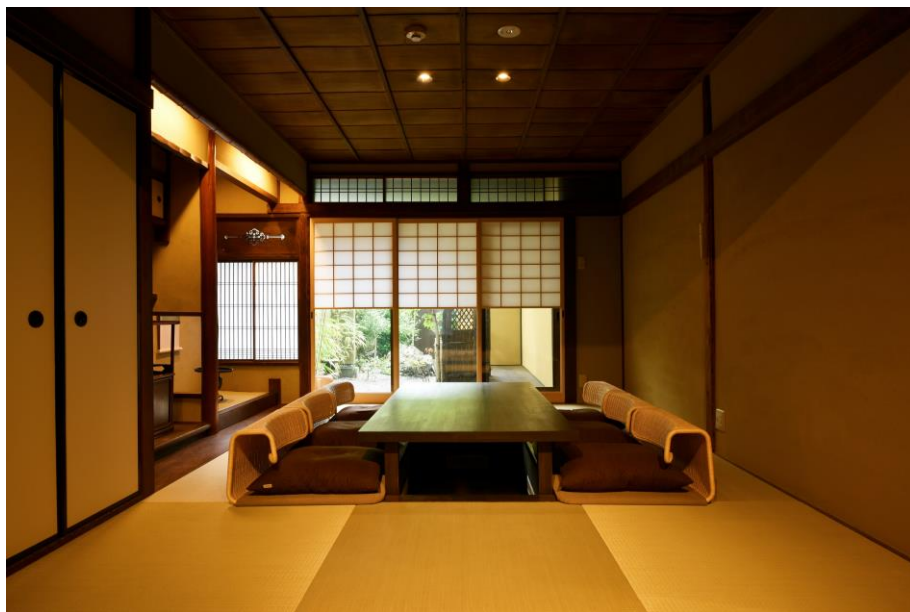
藏や千本三条内観 2