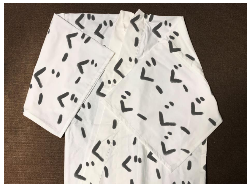
しりあがり寿手描き浴衣イメージ