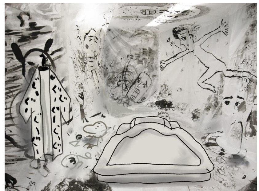
作品完成イメージ